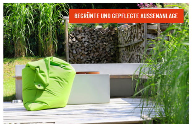
BEGRÜNT UND GEPFLEGT AUSSENANLAGE