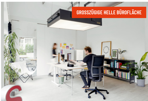
GROSSZÜGIGE HELLE BÜROFLÄCHE