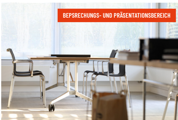
BEPSRECHUNGS- UND PRÄSENTATIONSBEREICH