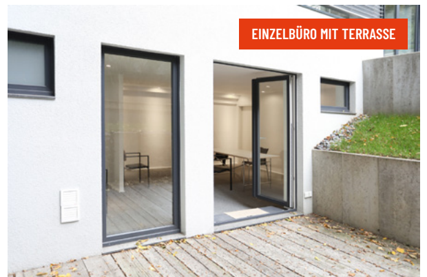
EINZELBÜRO MIT TERRASSE